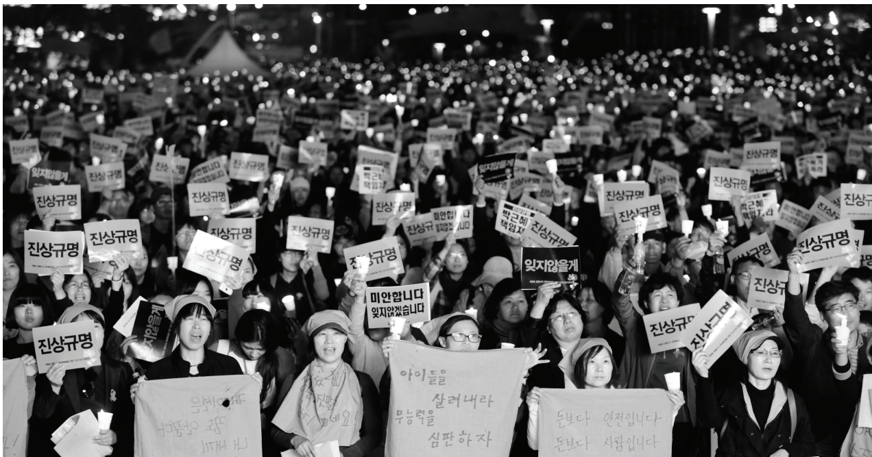
“모두 바로 잡을 때까지 울지 않겠습니다” 2만 명이 모인 5월 10일 안산 촛불 집회