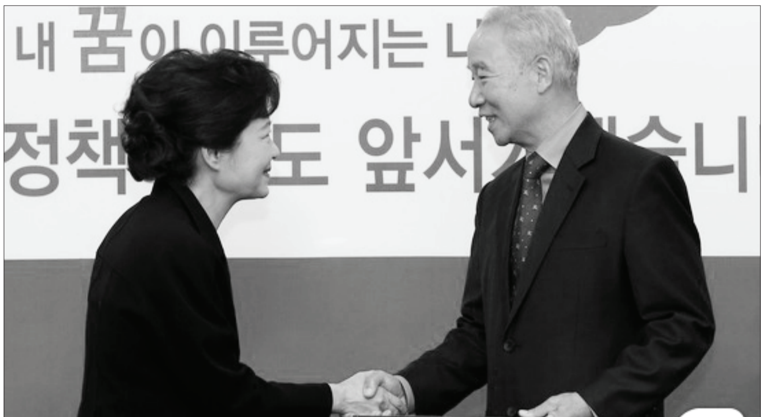
손 잡은 박근혜와 남재준 - 민주주의의 시계를 거꾸로 돌리려는 공모자들

박근혜는 이런 마녀사냥을 연막 삼아 기초노령연금 등 복지 공약을 대량 '먹튀'할 수 있었다. 박근혜는 경제위기 시기에 재벌들의 뒤를 봐주기 위해 앞으로 더 많은 공약 뒤집기를 밀어붙일 것이다. 이 때문에 진보 진영과 운동을 억누르기 위한 노골적인 반동 정책 또한 계속 시도될 것이다